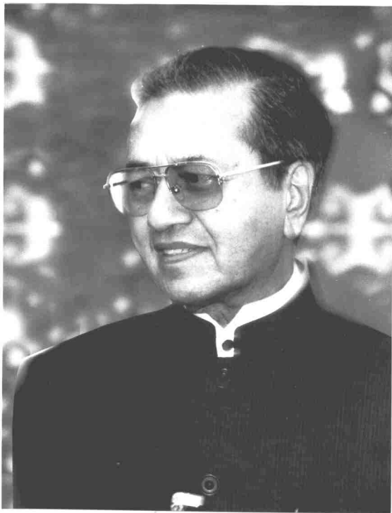
Y.A.B Dato-Seri Dr. Mahathir Mohamad